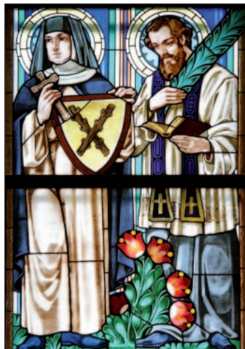
Santa Zdislava e San Giovanni Sarkan-der, in una vetrata della chiesa dei Santi Cirillo e Metodio a Olomouc.