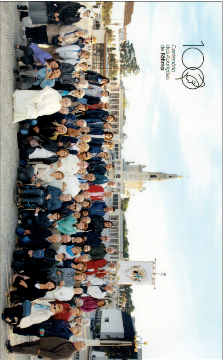
35º PELEGRINAGGIO DOMINICANO DEL ROSARIO A FATIMA (16-19 ottobre 2017)