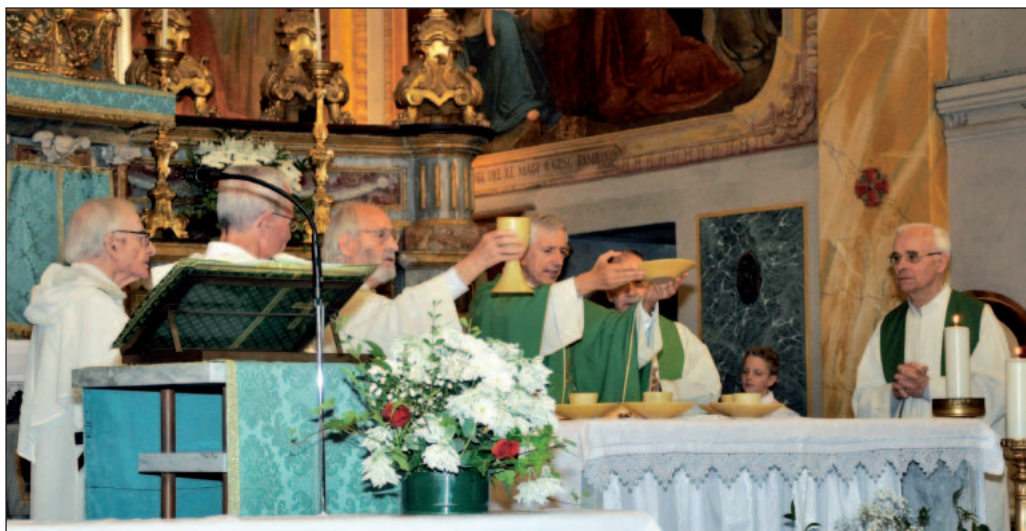
Poirino (To), domenica 24 settembre 2017: incontro annuale degli Amici e Devoti del Venerabile Silvio Disseгна.

I bambini talvolta sono tenuti lontani dalla salma di un parente defunto, tu, Silvio, hai convissuto con la morte da quando hai accettato di "salire sulla croce".