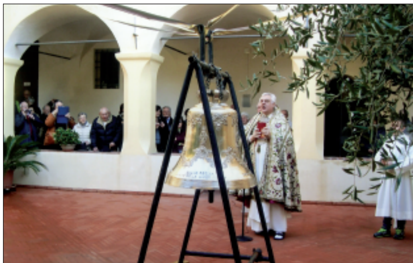
L'8 dicembre 2015, in occasione dell'inizio del Giubileo della Misericordia, la Comunità domenicana di Varazze ha benedetto la nuova campana "La misericordiosa", regalata perché segni momenti di invocazione della misericordia di Dio e canti la lode all'eterna sua misericordia.