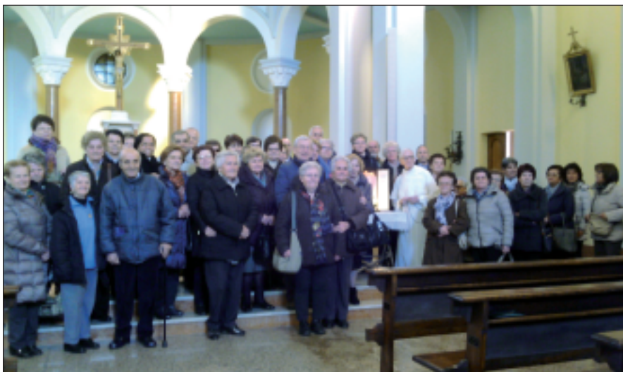
Il gruppo dei partecipanti all'incontro del 12 marzo 2016 a Paschera S. Carlo.