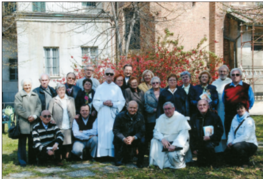
Foto di gruppo nel cortile del convento.

baldi e Fra Pasquale. Sono stati contemplati i Misteri gaudiosi: dire che è stato un Rosario speciale è troppo poco!