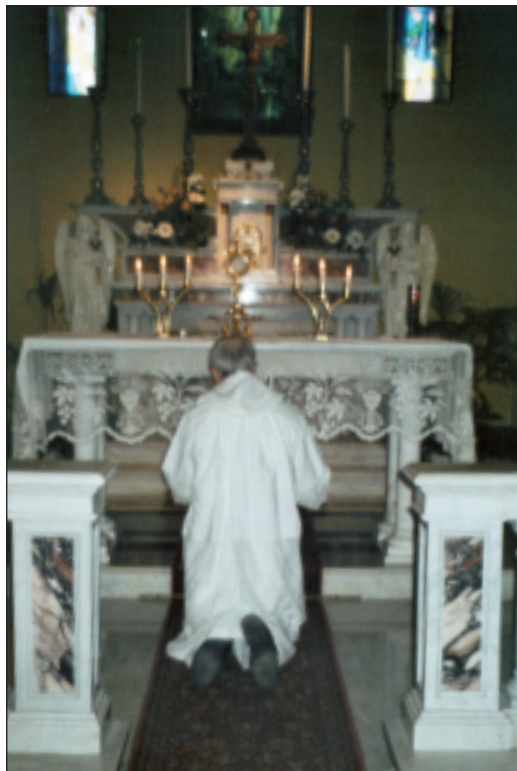
L'adorazione eucaristica del lunedì 26.

e piena di fede e di amore, ha accomunato i fedeli in un grande sentimento di pace e di serenità, di amore alla Vergine al suo Figlio Gesù.