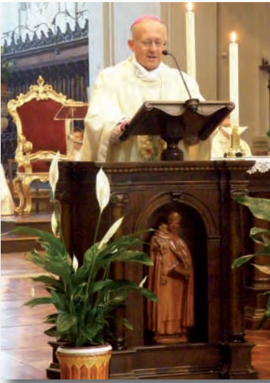
Mons. Ghirelli durante l'omelia

Alle ore 18,00 è costante la presenza di un vescovo. Quest'anno abbiamo avuto il piacere di avere fra noi, mons. Tommaso Ghirelli , vescovo di Imola, del quale proponiamo l'omelia tenuta durante la S. Messa.