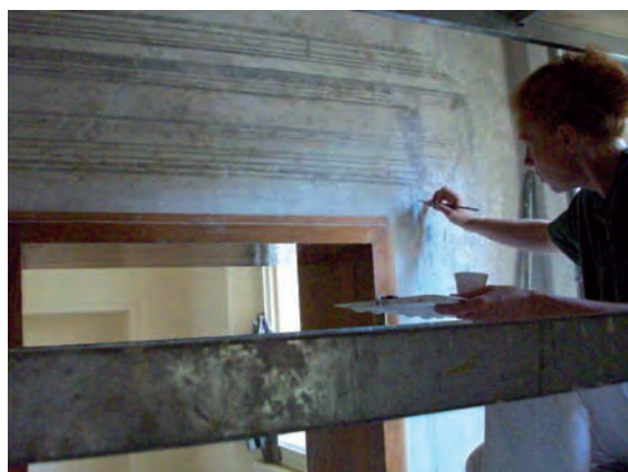
Il delicato lavoro di restauro

L'intervento riguarda l'adeguamento igienico e impiantistico delle residenze del Padre Provinciale, dell'economista di Provincia e di una stanza per un eventuale ospite situati al piano terra del complesso del convento di San Domenico. Quest'ala è una delle parti più antiche del convento, e risale alla metà del '500. Agli alloggi si accede dal corridoio che