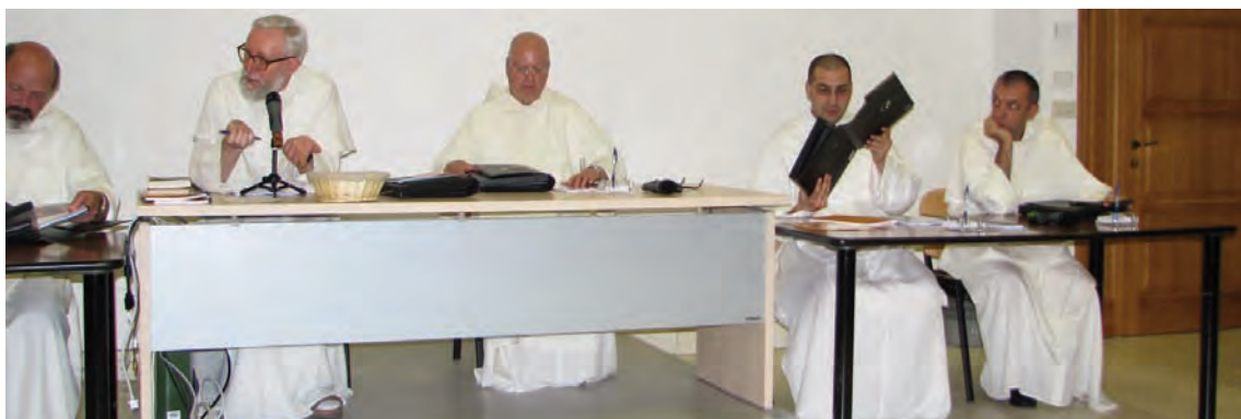
Un momento dell'Assemblea Capitolare

L'anti-ciclone delle Azzorre regala a Bologna caldo torrido e in più la solita afa. Ma afa o non afa i delegati al capitolo provinciale a Bologna devono arrivare. E i capitolari, accaldati, arrivano.