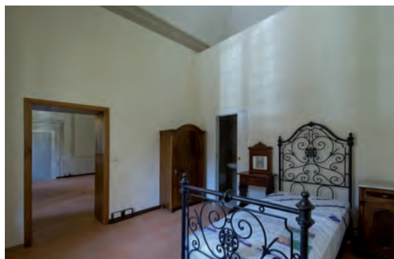
Una stanza dopo i lavori

Per le porte interne si sono riutilizzate le vecchie porte restaurate, mentre il vano che collegava la stanza per le udienze dell'alloggio del Padre Provinciale con la camera dell'economista di Provincia è stato tamponato con un pannello di cartongesso fonoisolante, mantenendone però visibile la traccia per lasciare un segno della trasformazione.