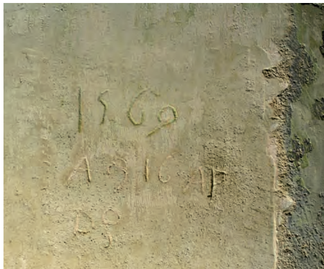
L'incisione con la data della fine dei lavori

Particolare cura è stata dedicata al recupero e restauro conservativo delle pitture parietali e degli stucchi dell'alloggio del Padre Provinciale.