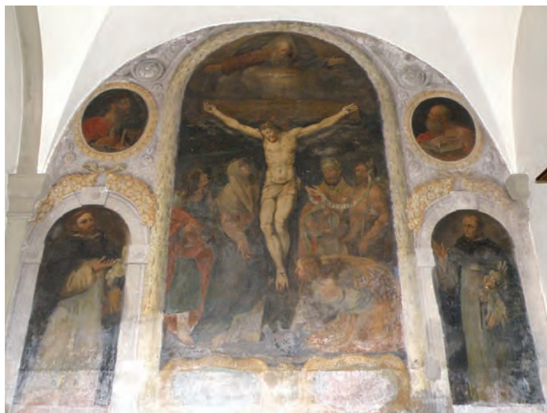
La cappella dell'Inquisizione

mediante un ingegnoso mulinello, poteva attingere con estrema facilità l'acqua dalla cisterna. Il medesimo padre nel chiostrino interno, tra le colonne doriche dei due porticati tipicamente "morandiani", fece disporre dei bancali coperti di macigno; in capo al porticato orientale, verso il muro della sacrestia, allestì l'altare per la celebrazione della messa per i reclusi, ornandolo con una Crocifissione (1580-1585) affrescata da anonimo maestro bolognese di scuola manierista (maestro Felice?).