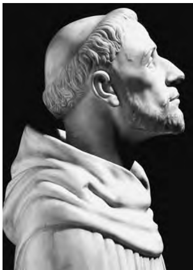
CARLO PINI, Il vero volto di S. Domenico , Cappella di S. Domenico, Bologna.

L'annuale celebrazione della solennità del S. Padre Domenico a Bologna è rimasta al 4 agosto. È preceduta da un triduo di preparazione e durante il giorno 4 alcune celebrazioni eucaristiche assumono un particolare significato per la partecipazione dei celebranti.