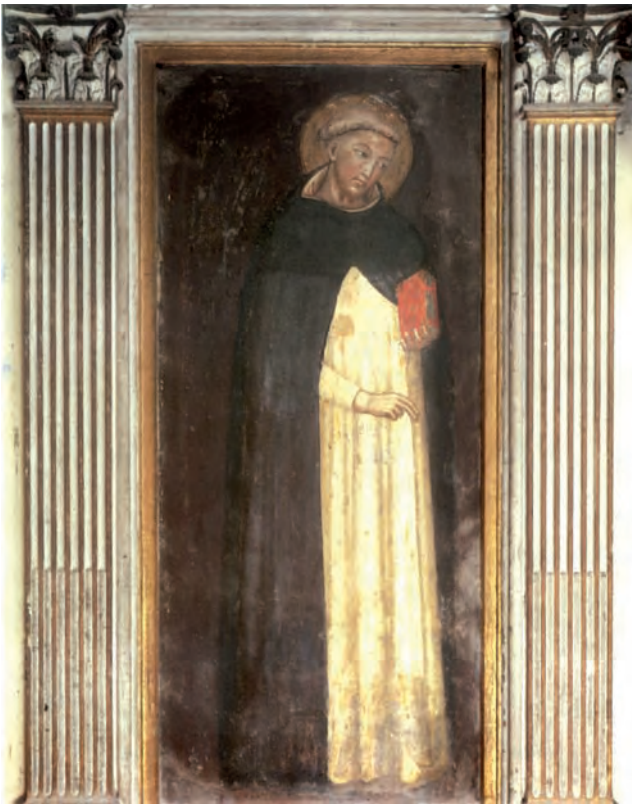
ANONIMO BOLOGNESE DEL XIV SEC., San Domenico , Capitolo del Convento di san Domenico. È la più antica immagine del Fondatore dell'Ordine Domenicano.

Per quanto riguarda la legislazione e le decisioni di portata generale, Domenico si ispira all'assioma del Diritto romano che i canonisti del tempo hanno fatto