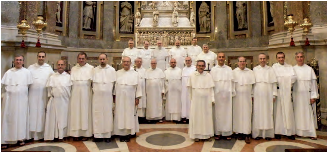
I Capitolari presso l'Arca di S. Domenico

Per la seconda volta nella storia dei Domenicani d'Italia, i componenti dei tre definitori italiani, nei giorni 22 e 23 luglio si sono incontrati a Montecompatri, (Roma), ospiti delle consorelle del Cenacolo Domenicano, per dibattere problemi comuni. È intervenuto anche il Maestro dell'Ordine che ha dato sue indicazioni.