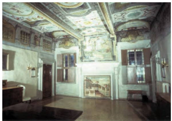
Sala della Consulta

Nel 1663 l'inquisitore padre Giovanni Vincenzo Paolini, risarcito il tetto sovrastante, fa soffittare e dipingere la Sala della Consulta (oggi chiamata sala dell'Inquisizione).